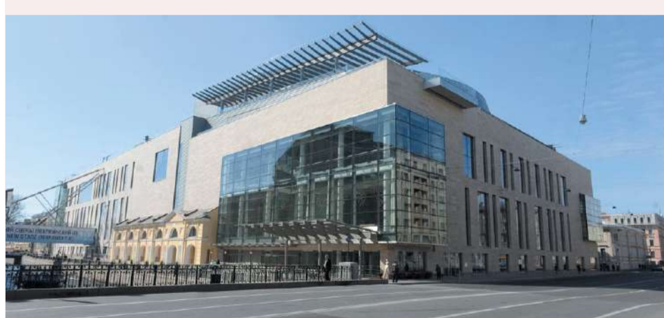
Вторая сцена Мариинского театра

Однако, очень скоро у дома на Пушкарской неожиданно объявился новый владелец - в лице Театра балета и Академии танца Бориса Эйфмана, в интересах которых, с позволения Комитета по государственному контролю, использованию и охране памятников истории и культуры (КГИОП), решено было построить на этом месте гостиницу для артистов, приезжающих в театр Эйфмана на гастроли, а также интернат для воспитанников академии. Почему построить? Да потому, что учреждение Эйфмана и привлеченная им на мало понятных условиях строительная компания Setl Group явно не собираются проводить глобальную реконструкцию здания, а намерены просто снести его, воздвигнув очередной ношевод. Это легко можно уяснить, ознакомившись с результатами заказанной ими же самими (!) экспертизы